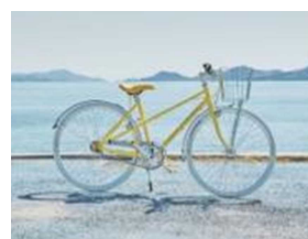
SHIMANAMI LEMON BIKE

「SHIMANAMI LEMON BIKE」と、せとうち広島DCに合わせて登場予定の、坂道も楽々、気軽に楽しめる電動自転車「SHIMANAMI LEMON e-BIKE」の2種類からお選びいただけます。