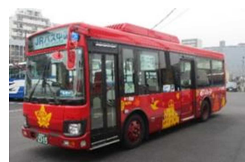
「めいぶる〜ぶ」バス 外観イメージ