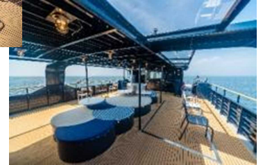
「SEA SPICA」外観（左）、2階屋外デッキ「スピカテラス」（右上下）