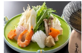
▲土佐の伝統野菜を使用した夕食

2024年11月15日（金）に開通100周年を迎えるにあたり、各地域における鉄道利用促進や賑わいづくり、利用者及び沿線市民の皆様との交流拡大に寄与する事を目的に、関係自治体と協働し、記念イベント等を実施します。