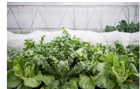
▲土佐伝統野菜の畑