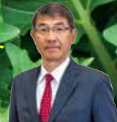
高知市 桑名 龍吾 市長

高知ならではの豊かな自然、海や山の幸、 そして温かい人柄といった私達の誇る郷土の魅力を 心ゆくまで満喫してください。