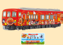
ダイヤベット DK-7131 土讃線あかいアンパンマン列車