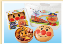
げんき100ばい! アンパンマン弁当