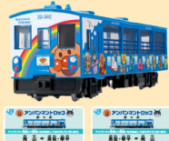
ダイヤベット DK-7133 アンパンマントロッコ