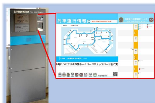
サイネージの設置（例）