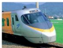
リニューアル対象電車（8000系）