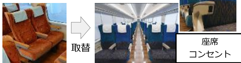
当社の最新車両と同様の座席に取替等