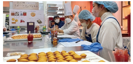
※掲載写真は全てイメージです