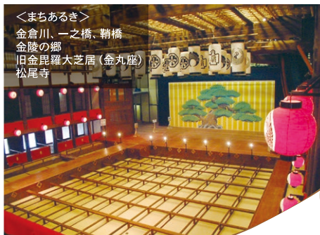
旧金毘羅大芝居(金丸座)