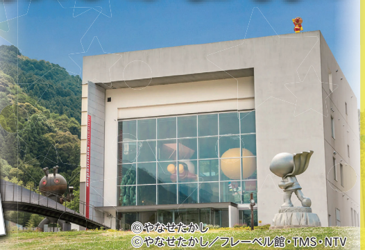
※出発日より「あかいアンパンマン列車」となる場合があります。 ©やなせたかし / フレーベル館・TMS・NTV