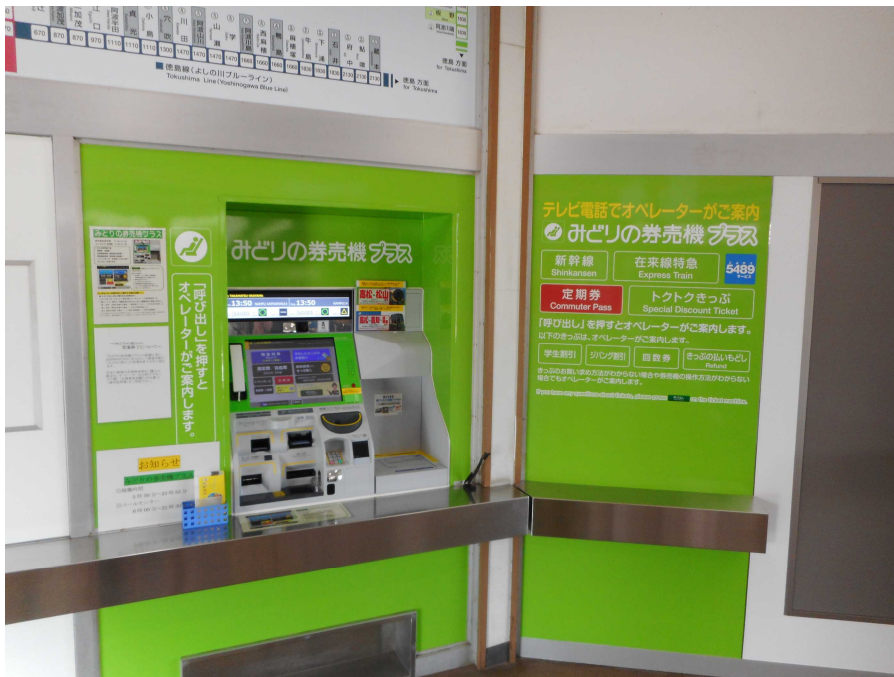
※上記写真は、善通寺駅の写真です。