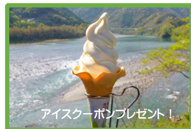
アイスクーポンプレゼント！