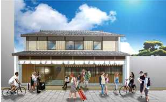
外観イメージパース