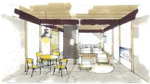
施設内イメージパース